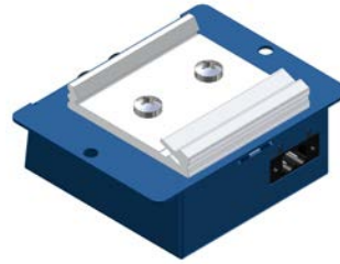
Montage mit Clip Mounted Clip