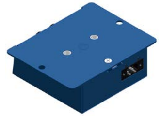
Wandmontage Wall mounting