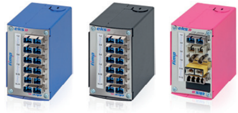
Verschiedene Gehäusefarben und Kupplungsvarianten